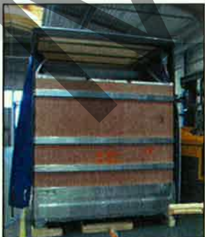
Heckwand mit XL PIN